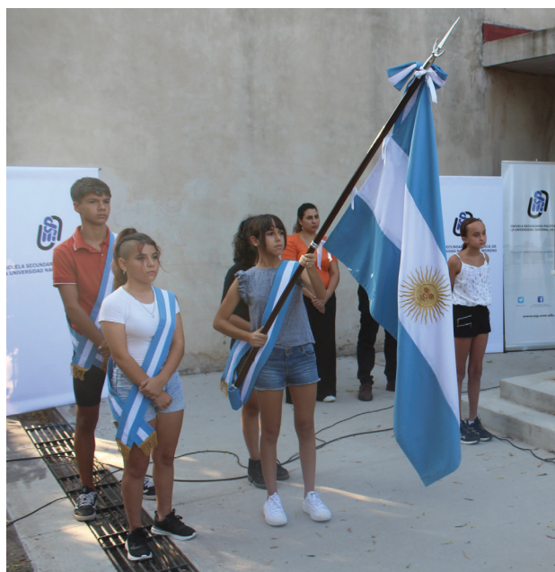
Este 2023, la ESPUNM abre la tercera cohorte de sus dos primeras orientaciones.

En el marco de la actualización de prácticas, se profundizará el abordaje de los aprendizajes emergentes con utilización de recursos tecnológicos aplicados, fundamentalmente en las áreas de Robótica y Diseño y Producción Multimedial, a las que se incorporarán en el próximo ciclo lectivo conocimientos sobre Inteligencia Artificial. Es por eso que trabajamos en la cobertura de los recursos necesarios para el desarrollo de prácticas con softwares específicos,