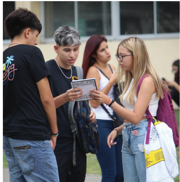
Las cuatro nuevas carreras tendrán un ciclo de formación común.

Decidimos planificar el ciclo común con un profundo recorrido porque reflexionamos en cómo se entiende el trabajo de un diseñador. Para explicarme mejor, todos saben (a grandes rasgos) qué hace un médico, un ingeniero, un docente o un abogado y esto se debe a que existe un conocimiento elemental, una metodología de aplicación específica y una materialización muy clara de esas profesiones, pero en el campo del diseño eso está confuso. Esto se debe a la segmentación y especialización que se produjo a lo largo del tiempo en la enseñanza y formación de los profesionales. Entonces pensamos para nuestros estudiantes un abanico de saberes teóricos y prácticos, elementales y fundantes de una genética profesional de alto nivel, que les permitan construir interfaces (productos) entre el conocimiento científico (saberes tecnológicos), la cultura (elementos comu-