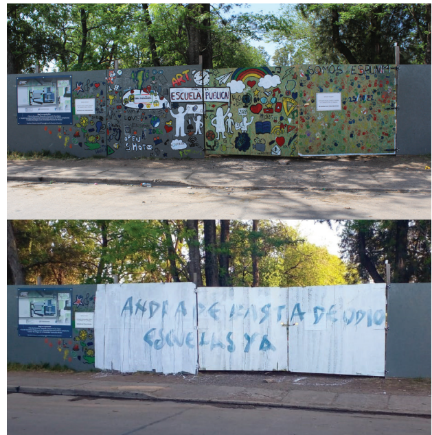
Mural realizado por los y las estudiantes: antes y después. Mural realizado por los y las estudiantes: antes y después.

Luego, el 25 de octubre, fecha en que no había clases debido al asueto por el aniversario de la creación de nuestro partido, los y las jóvenes, con la participación de docentes y directivos, realizaron una intervención artística sobre la pared del inmueble de la calle Merlo y pintaron un mural que expresó "¡Viva la escuela pública!". Pero, con mucho pesar, la comunidad educativa se encontró, unos días des-