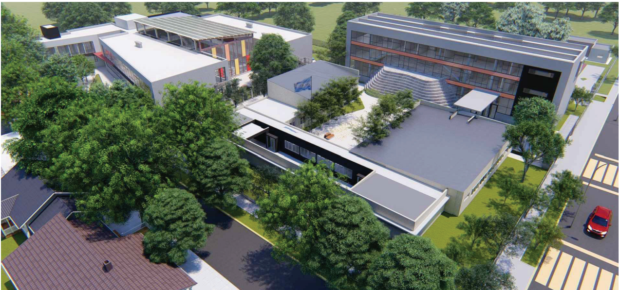
El proyecto de la obra ITUNM-ESPUNM contempla un total de 7500 m 2 .

Si se quiere, lo que se tensiona desde los albores del siglo XX hasta hoy es la tradicional misión social de la Universidad reducida a formar las elites. Las nuevas universidades del siglo XXI también están interpeladas por el conjunto de problemas estructurales del sistema, pero nacieron involucradas en la voluntad de contribuir efectivamente a la profundización de un proyecto de país con desarrollo económico, una democracia participativa con justicia social, una educación de calidad vinculada al desarrollo del conocimiento, de la ciencia y la tecnología y un rol protagónico en el desarrollo local dentro de su jurisdicción de influencia; lo que ha implicado una articulación nueva con la sociedad, con sus sectores productivos y con el Estado, tanto nacional como provincial y municipal.