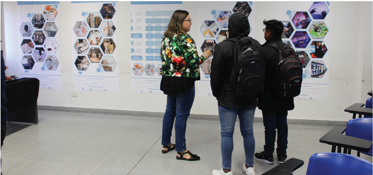
Las carreras de Diseño fueron presentadas a la comunidad en la ExpoCarreras de 2022.

La UNM, en su decimotercer ciclo lectivo, incorporó a su oferta académica cuatro carreras de grado y cuatro tecnicaturas universitarias, todas relacionadas a la disciplina del diseño. La gran aceptación por parte de los aspirantes se vio reflejada en las inscripciones, donde Diseño de Indumentaria, con el 11% del total de inscriptos, fue una de las tres carreras más elegidas.