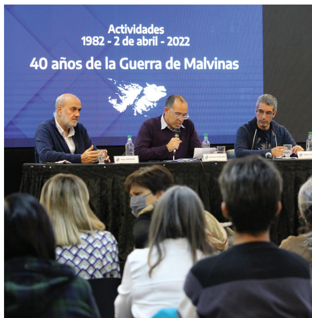
En 2022, la comunidad universitaria ya había conmemorado los 40 años de la Guerra de Malvinas.

Se decretó lo que sería otro de los hechos históricos más movilizantes de la Argentina: el juicio a los miembros de las tres juntas militares que usurparon el poder en 1976. Fueron los primeros pasos para recuperar el Estado de Derecho y marcar el fin definitivo de la dictadura militar instaurada el 24 de marzo de 1976, con un saldo de 30 mil desaparecidos y millares de exiliados políticos. Pero además, la ciudadanía recuperaba el derecho a votar y elegir