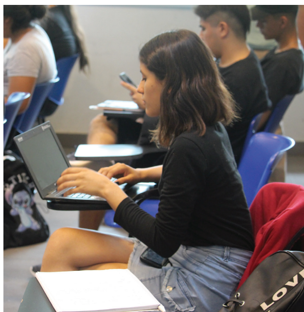
El COPRUN intensivo se desarrolló bajo una modalidad semipresencial.

Luego de una breve pausa estival, habiendo finalizado al 30 de noviembre un nuevo período de inscripción para el Curso de Orientación y Preparación Universitaria con un incremento del 29% de las inscripciones respecto del año anterior, a mediados de enero desde la Secretaría Académica de la UNM comenzamos la tarea de organizar los cursos (y la cursada) de una nueva edición del COPRUN.