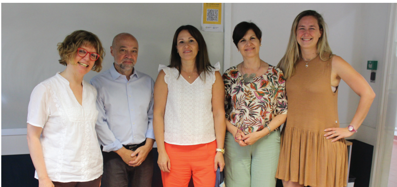
La carrera de Especialización en Lectura y Escritura tiene su primera graduada.

Desde hace ya algunos años, la Universidad Nacional de Moreno trabaja en una variada oferta de actividades y trayectos de Posgrados, como Especializaciones y Diplomaturas, con el fin de abarcar diferentes áreas temáticas que contribuyan a la inserción de nuestra casa de estudios en el medio local y regional. Hoy, la UNM tiene su primera graduada de Posgrado.